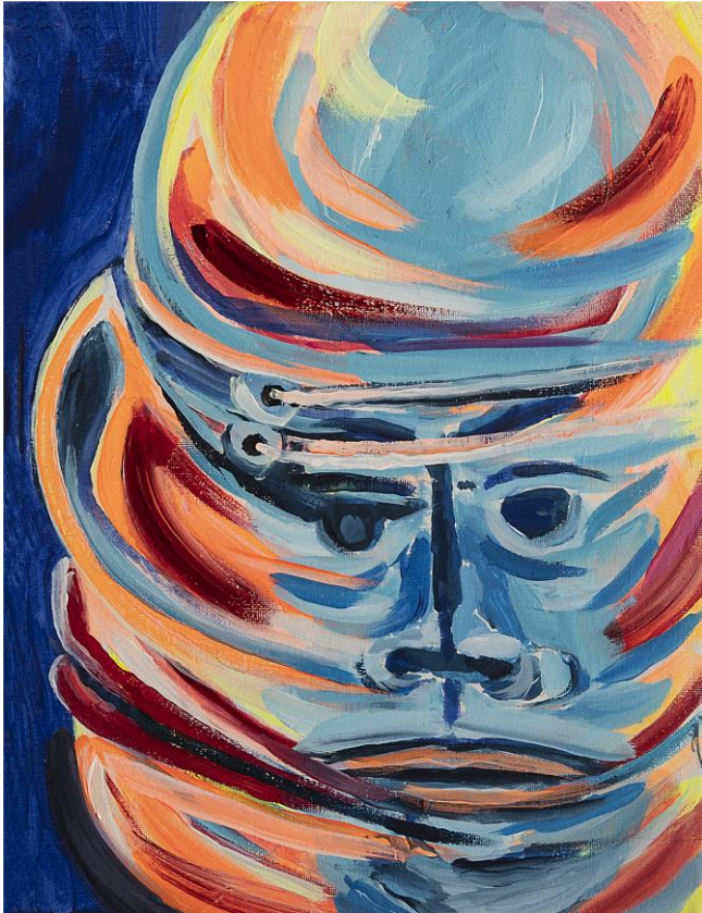
Acryl auf Leinwand ohne Titel 39 x 30 cm 2021