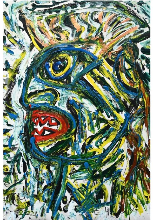
Mischtechnik ohne Titel 70 x 50 cm 2021