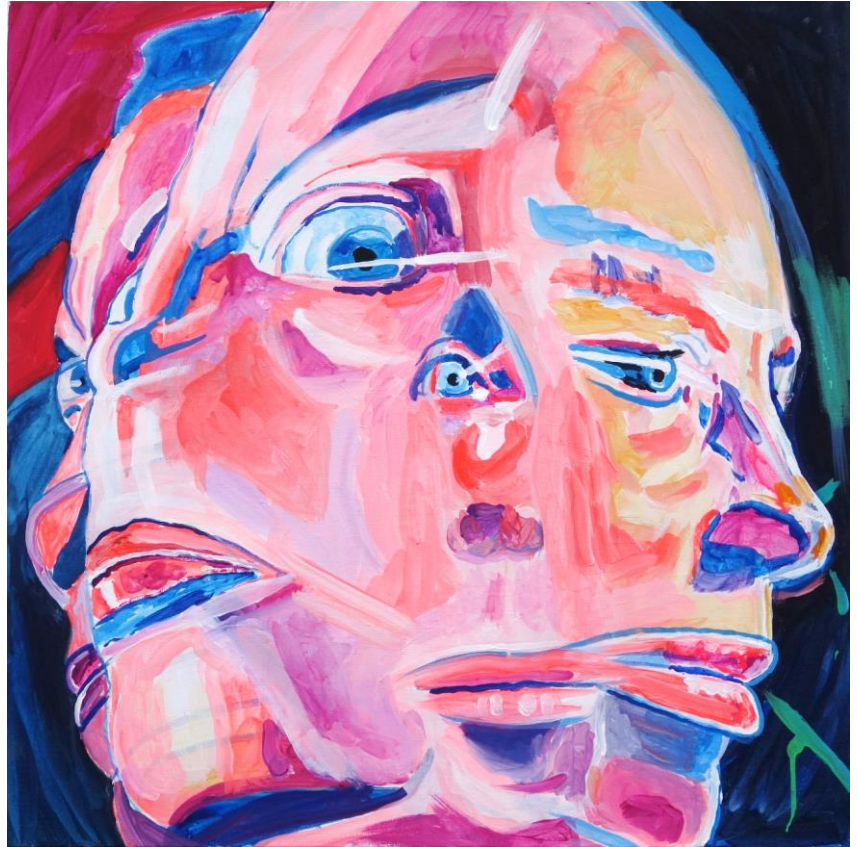
Acryl auf Leinwand ohne Titel 60 x 60 cm 2021