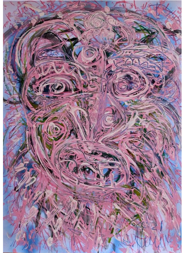
Mischtechnik ohne Titel 70 x 50 cm 2021