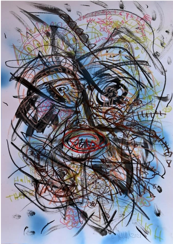
Mischtechnik ohne Titel 70 x 50 cm 2021