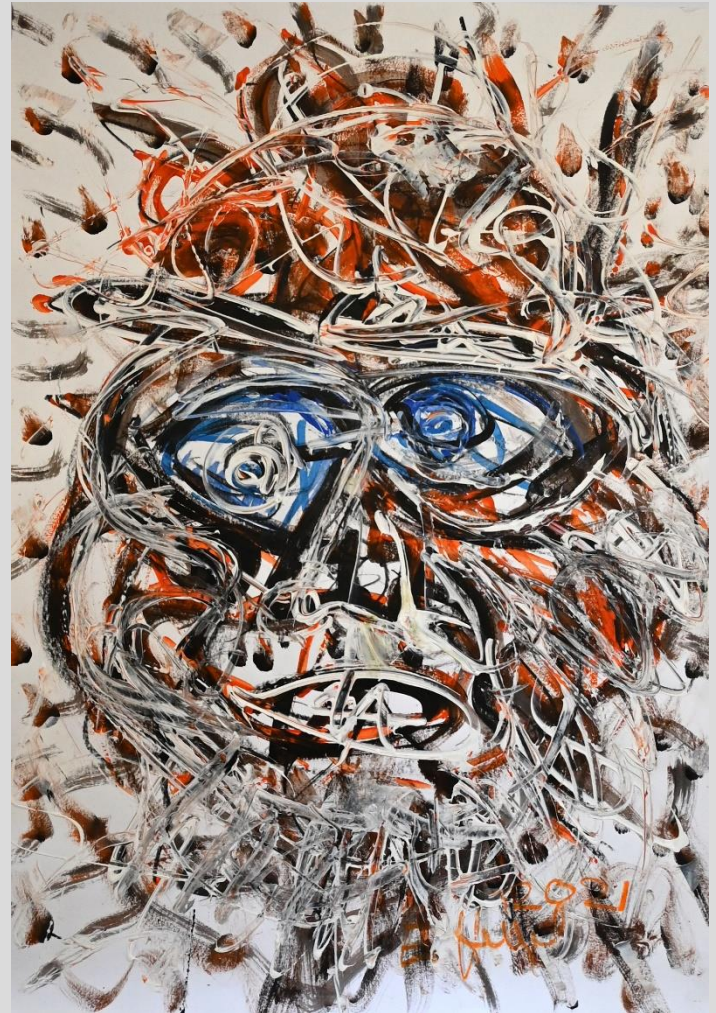
Elmar Hempel Mischtechnik ohne Titel 70 x 50 cm 2021

kulturpunkt im PROGR Bern Postfach 803, CH-3000 Bern 8 031 508 50 88 info@kulturpunkt.ch