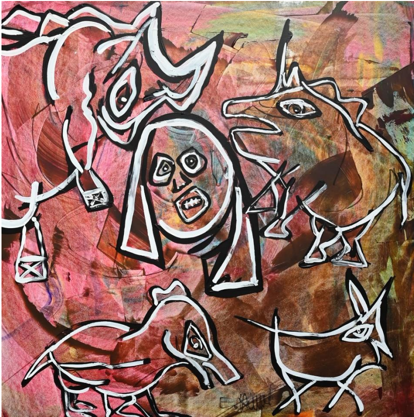
Mischtechnik ohne Titel 70 x 70 cm 2021